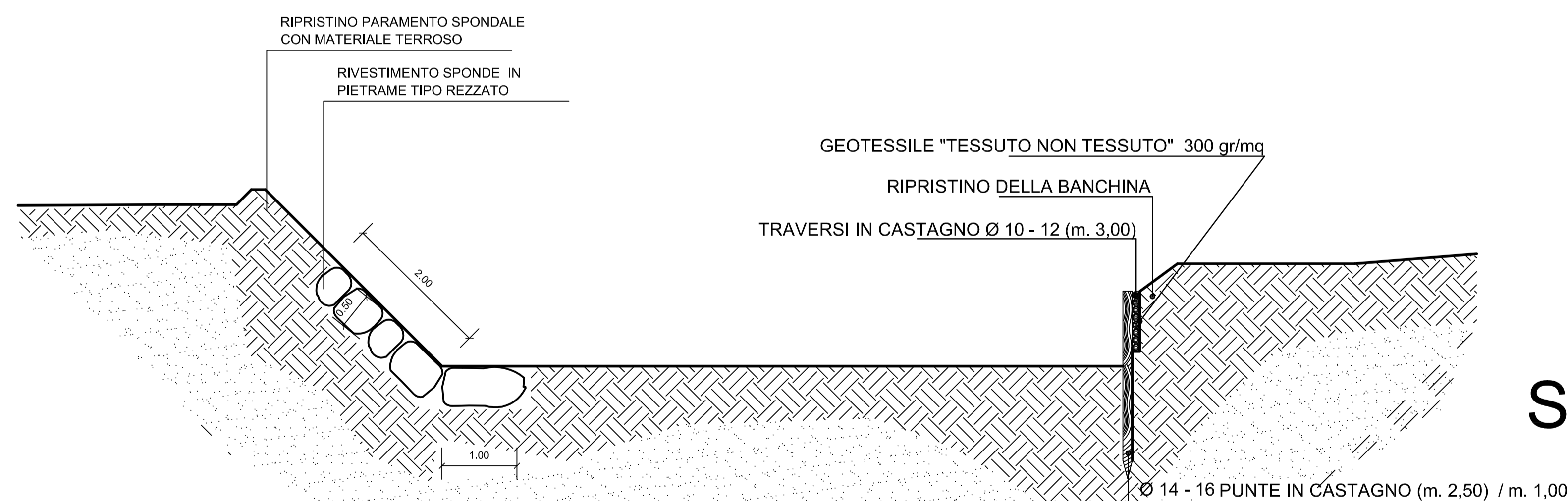
Sezione tipo 3