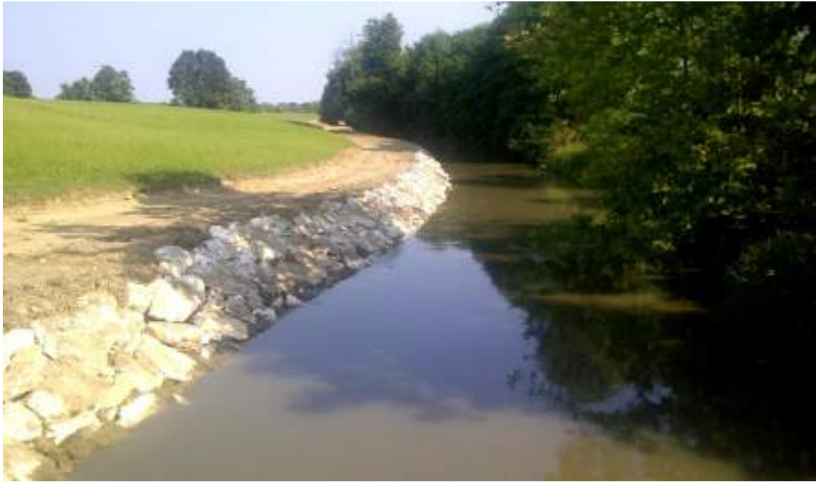
Colatore Venere – esecuzione di difesa idraulica in pietrame di tipo rezzato