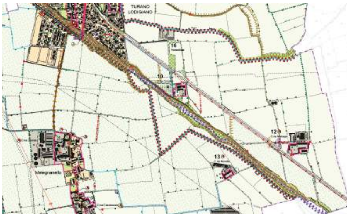
P.G.T. Documento di Piano - Carta delle componenti del paesaggio

La strumentazione urbanistica comunale del comune di Turano Lodigiano (Piano di Governo del Territorio) prevede, nel tratto oggetto delle lavorazioni, la presenza di aree agricole e boschi, per i quali non è prevista alcuna trasformazione e nel caso si rendesse in corso d'opera necessaria la rimozione di alcune essenze che inficiano il regolare deflusso idraulico, si provvederà alla compilazione dell'apposita istanza.