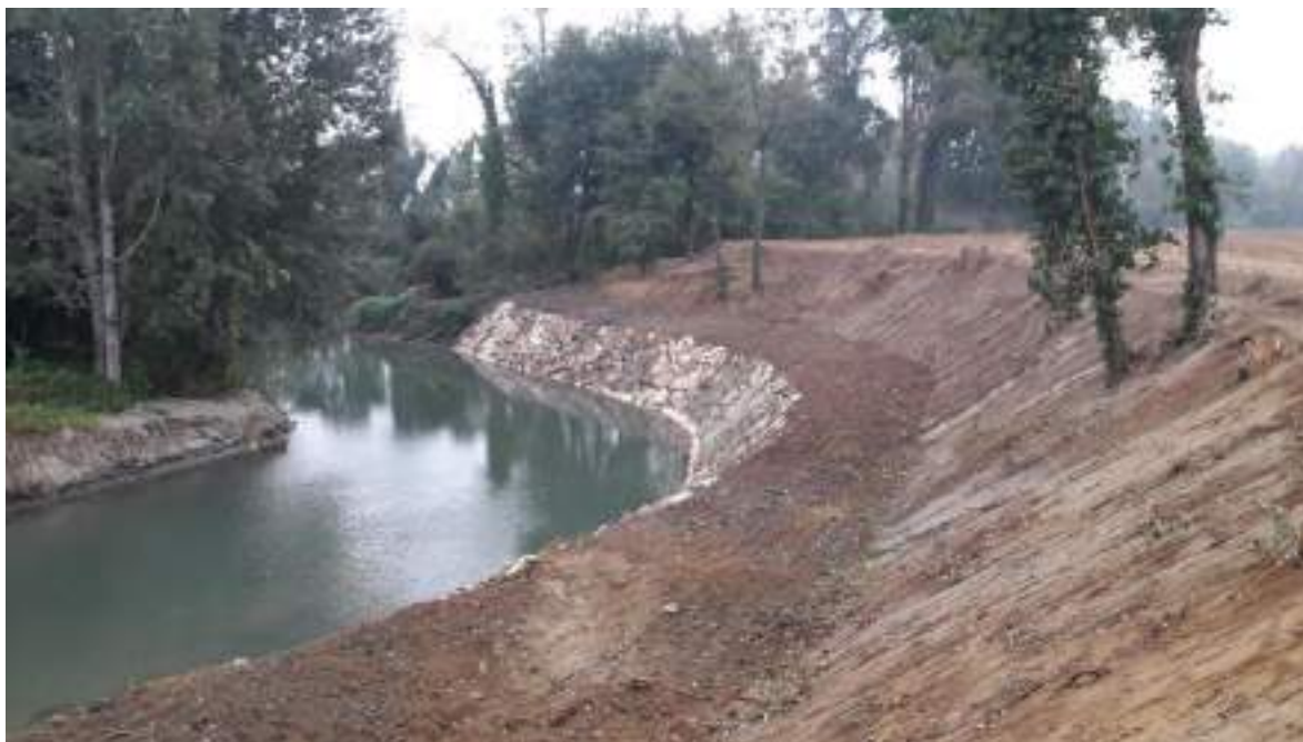
Difesa in pietrame eseguita sul Colatore Muzza in comune di Mairago

Con questa tecnica di consolidamento viene inoltre garantita la sopravvivenza delle specie di flora e fauna ittica che popolano le acque e le sponde del Colatore Muzza.