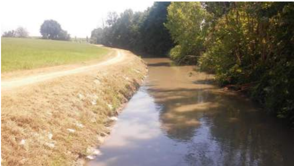
Colatore Venere – inerbimento del paramento spondale