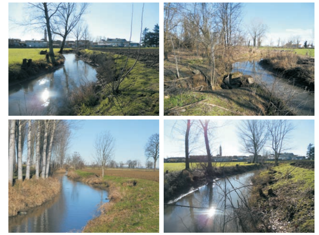
Frane esistenti lungo il tratto ponte canale Roggia Frata Ospedaletta (S2) al centro abitato di Livraga