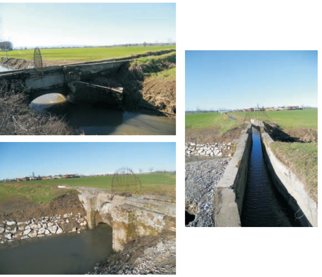
Ponte canale Roggia Filisetto su Colatore Venere