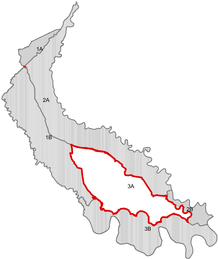
Planimetria di riferimento