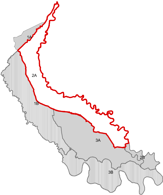
Planimetria di riferimento