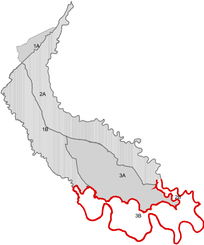
Planimetria del territorio