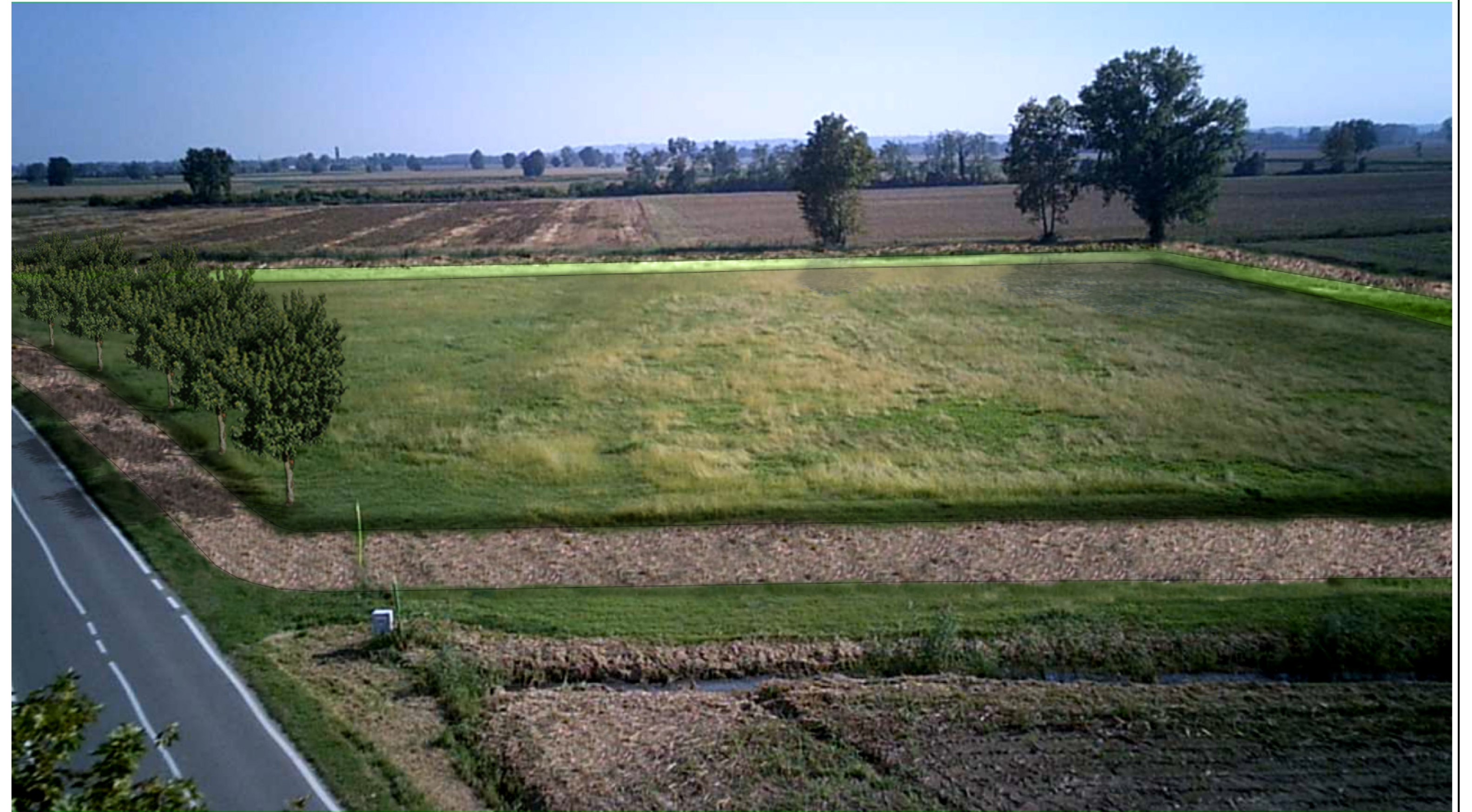
VISTA FOTOGRAFICA ASSONOMETRICA - stato di progetto