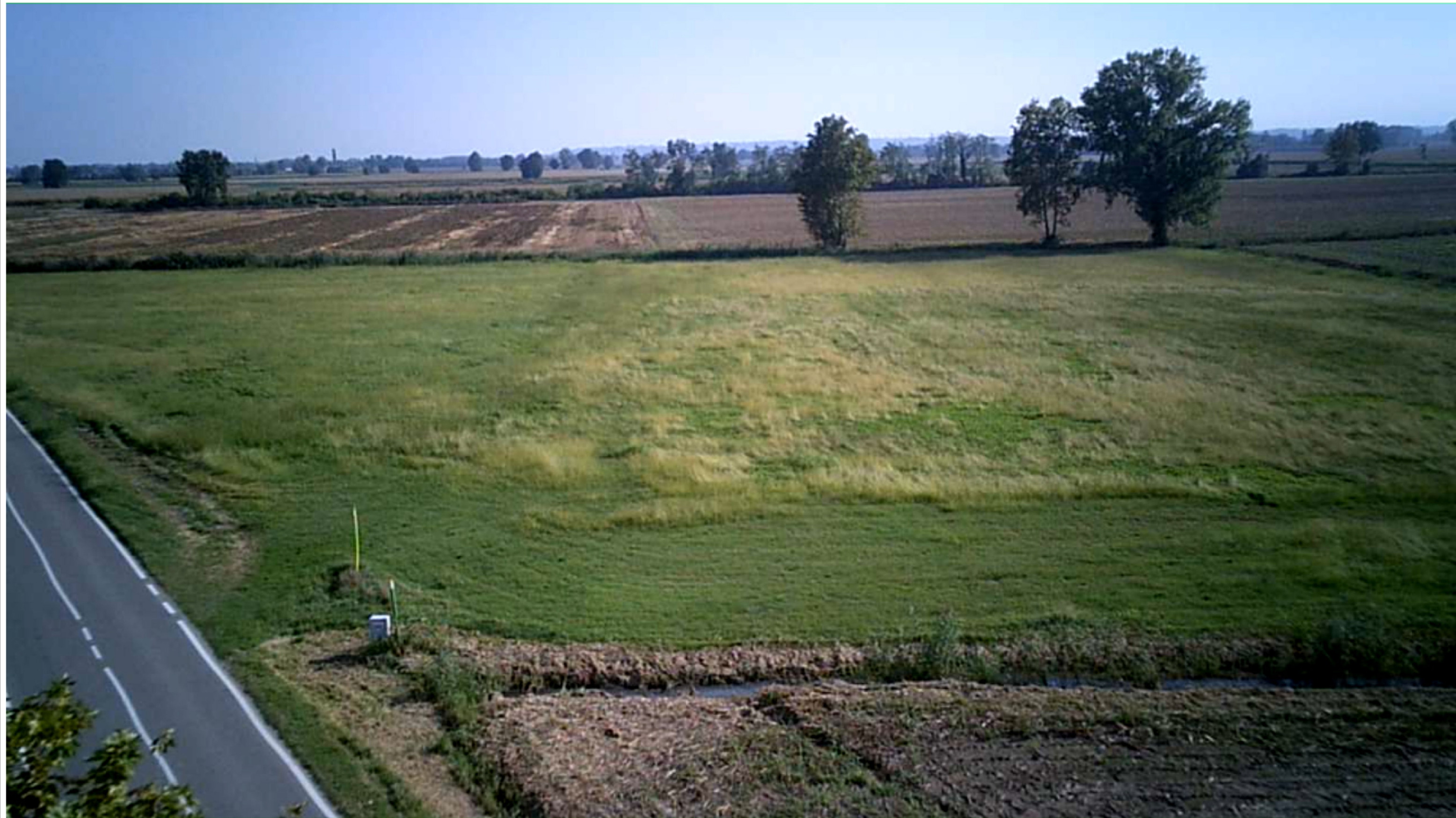
VISTA FOTOGRAFICA ASSONOMETRICA - stato di fatto