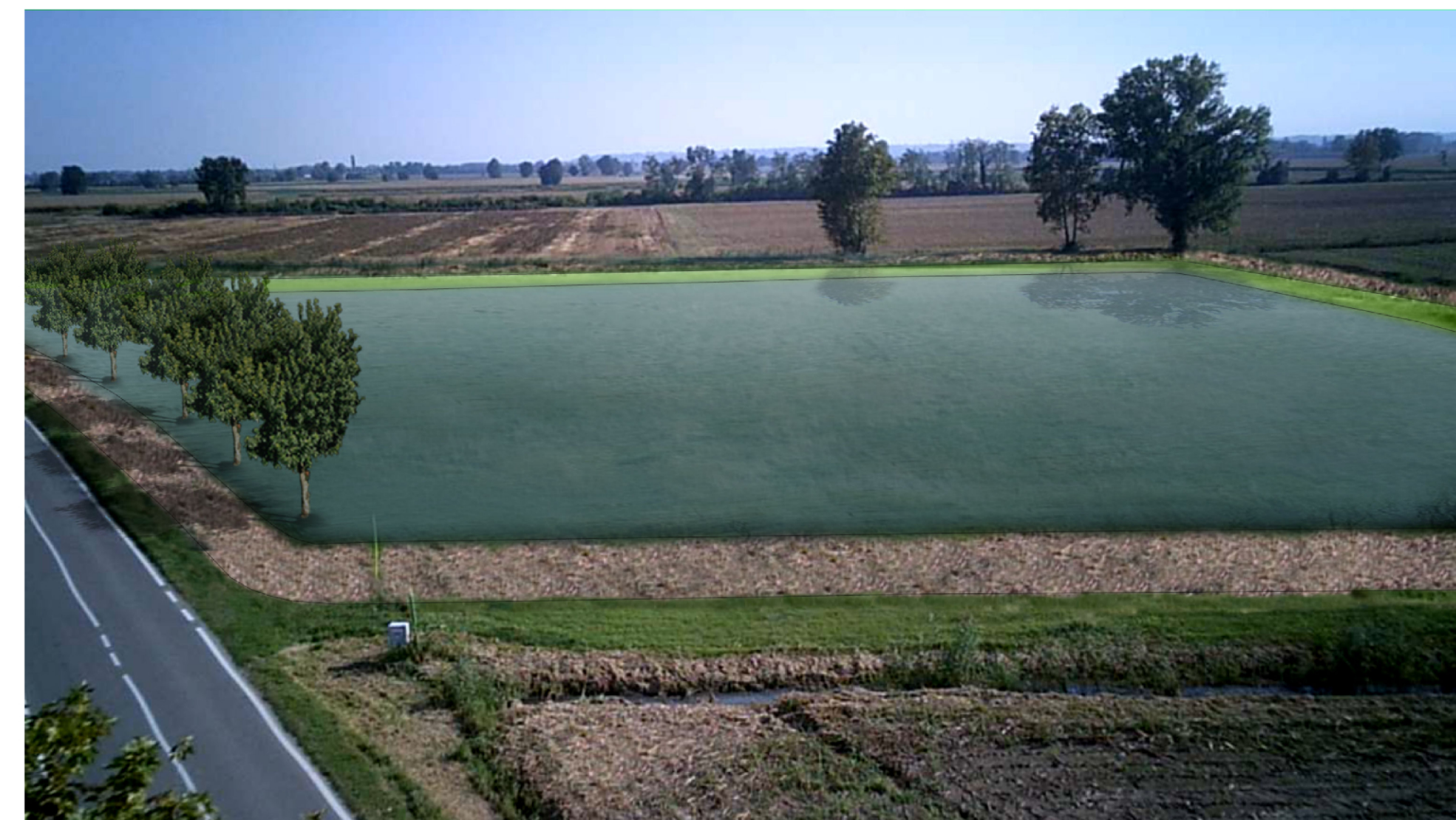
VISTA FOTOGRAFICA ASSONOMETRICA - simulazione allagamento

Consorzio Bonifica Muzza Bassa Lodigiana via Nino Dall'Oro 4 - 26900 LODI tel. 0371 - 420189 r.a. fax 0371 - 50393 email: cmuzza@muzza.it