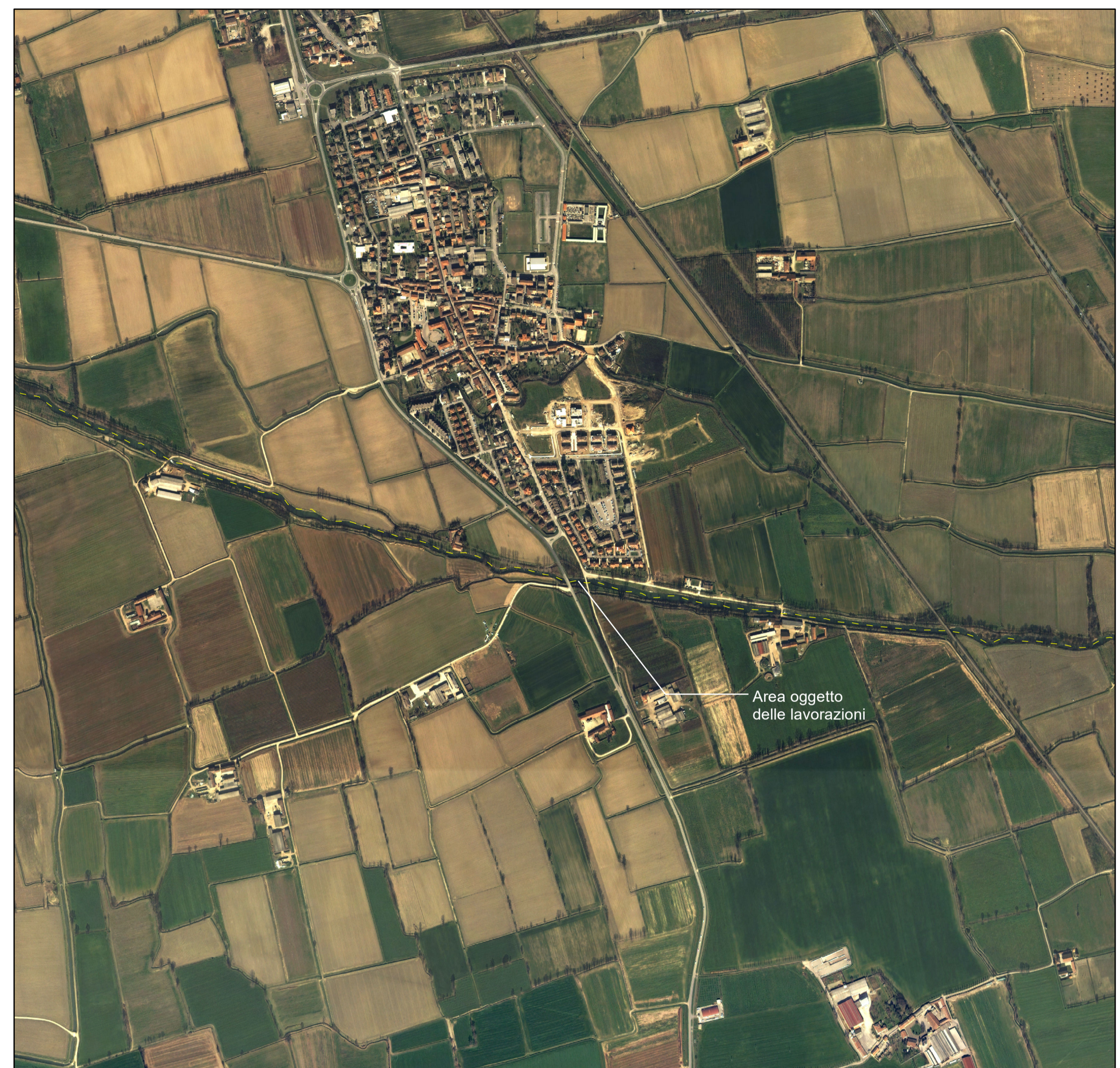
Planimetria di inquadramento alla scala comunale