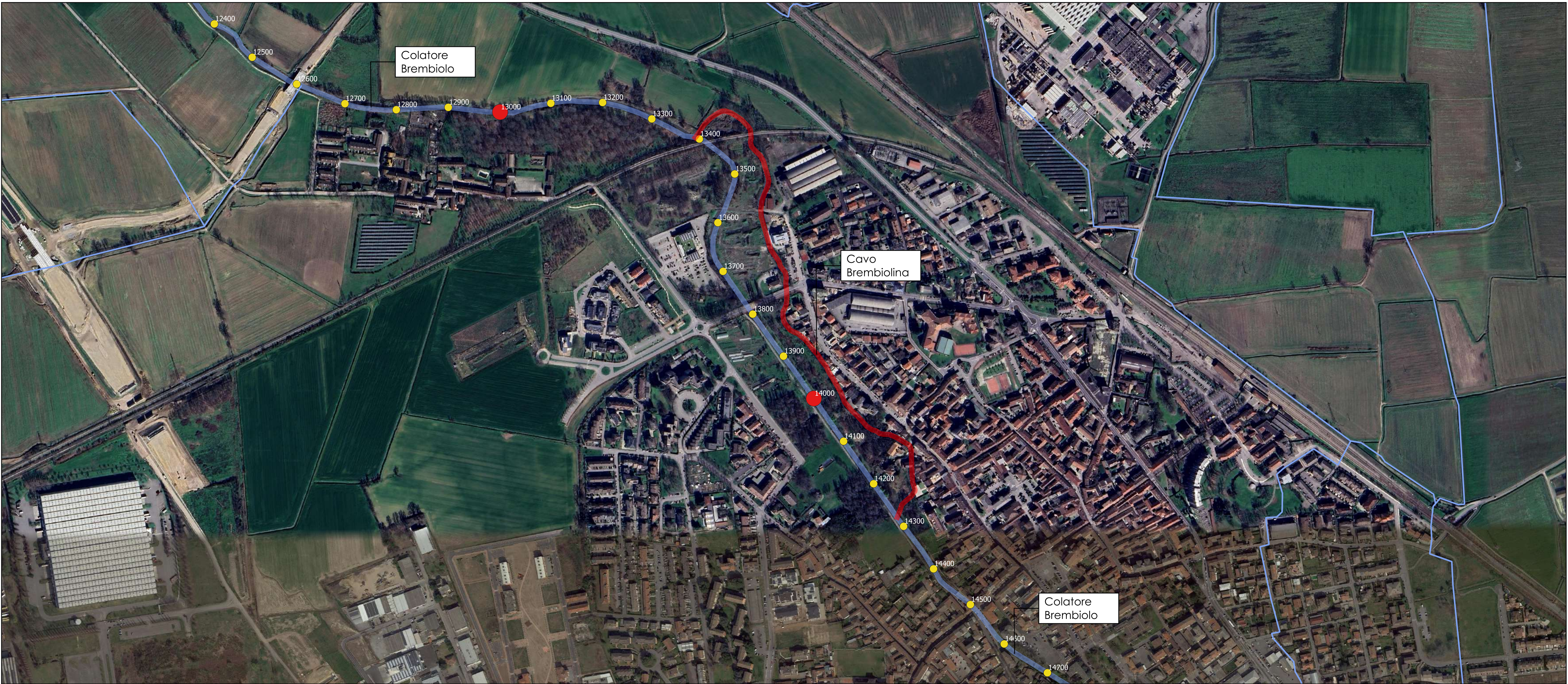
Planimetria generale scala 1:5.000 - Ortofoto